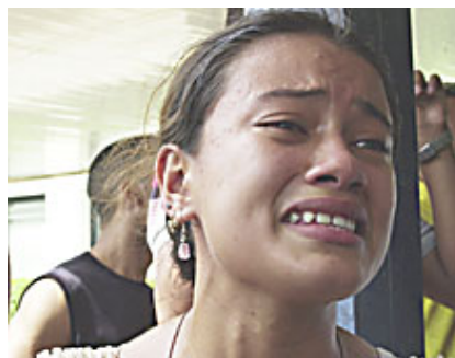
El cadáver del soldado fue trasladado al Hospital Universitario para hacerle la autopsia

Agregó: "Esto es un vandalismo lo que han hecho aquí, los militares y el gobierno de turno... ayer estaba muy contento, fue su mejor día... esto no puede ser... a mí nadie me ha explicado nada, ni los médicos ni nadie, no he recibido información de nada... mi hijo me preguntaba cuándo nos vamos de aquí y repetía que no quería volver a Forte Mara. Los militares estaban todo el tiempo locos por entrar a ver a mi hijo y siempre escondidos y haciendo seguimientos, seguro ya entraron y lo mataron... este es un gobierno dictatorial, satánico y vandálico".